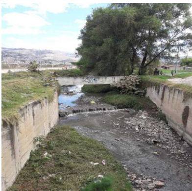
FOTO 1. ZONA VULNERABLE