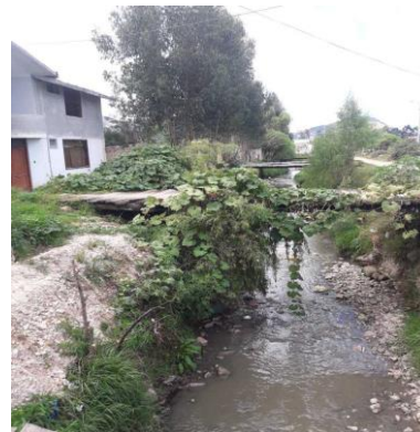
FOTO 1. ZONA VULNERABLE COLINDANTE CON VIVIENDAS