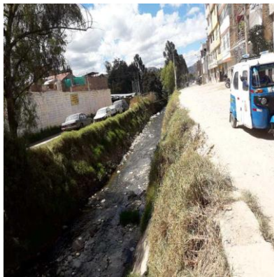
FOTO 1. ZONA VULNERABLE EN AMBAS MARGENES - ACCESOS VIALES